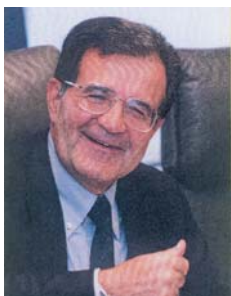
Menschen in der Zeit Romano Prodi – 65 Jahre Sendung: 8. August 2004

Romano Prodi wurde am 9. August 1939 als achtetes von neun Kindern eines Ingenieurs und einer Lehrerin in Scandiano bei Bologna geboren. Fünf seiner Brüder wurden – so wie Romano Prodi selbst – Universitätsprofessoren. Erste politische Erfahrungen sammelte der dem linken Flügel der Christdemokraten zugelegte, parteilose Prodi als Industrieminister in der Regierung Giulio Andreotti. 1995 präsentierte sich Prodi als Gegenspieler von Silvio Berlusconi und stellte ein Jahr später in Rom sein erstes Kabinett. Mit zähem Sparwillen machte er Italien ‚eurotauglich‘. Seine Regierung scheiterte aber bald an den Altkommunisten. 1999 wurde der Katholik Prodi vom Europäischen Parlament zum EU-Kommissionspräsidenten gewählt. Jetzt will er wieder in Italien als Gegenkandidat Berlusconis antreten.